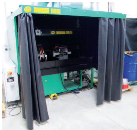
» Controrem dispose d'importants moyens de mesure et de contrôle pour les pièces aéronautiques