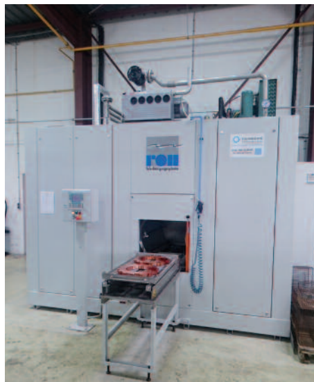
► L'an dernier, la société a investi dans une machine haut de gamme de lavage et de dégraissage de marque Roll