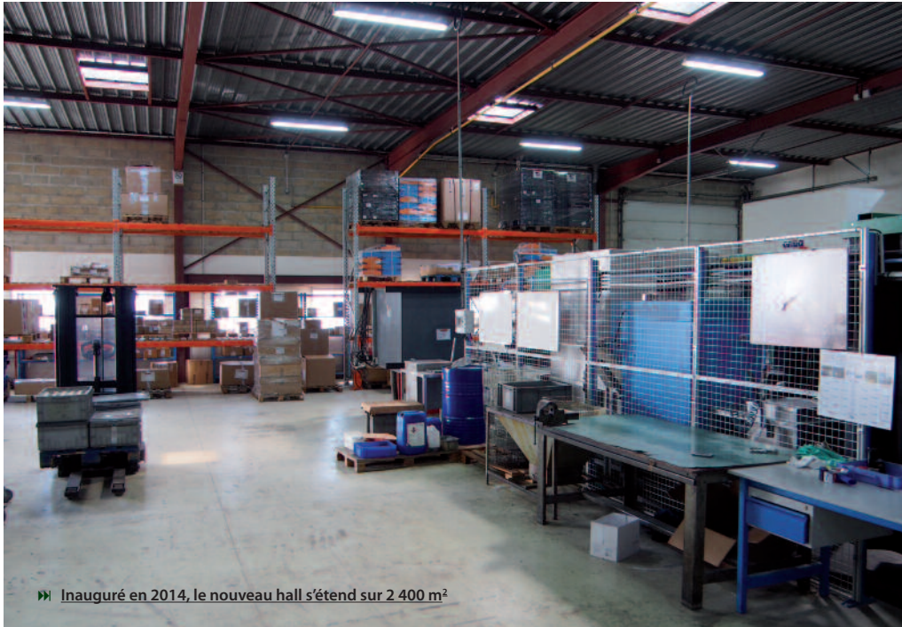
► Inauguré en 2014, le nouveau hall s'étend sur 2 400 m 2

bancs pour les pièces de petites et moyennes dimensions (jusqu'à 4,5 mètres). Depuis l'an dernier, CONTROREM s'est également équipé d'une machine de lavage et de dégraissage de marque Roll – modèle RCKS 100 055 040 02 qui travaille avec des solvants non chlorés DOWCLENÉ 1601 – distribuée en France par la société ECOBOME Industrie (située dans le Doubs).