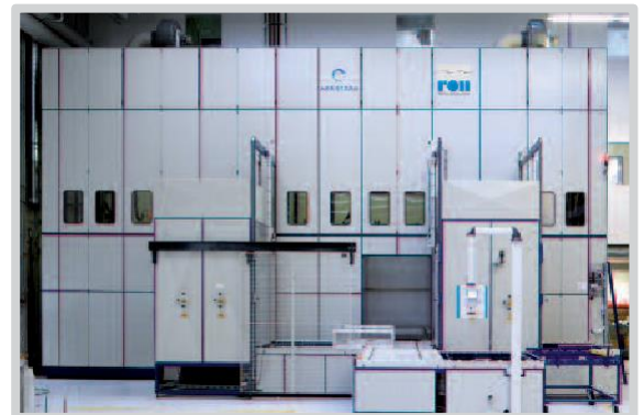
特殊设备，可用篮筐尺寸 1400 x 1100 x 1500 mm