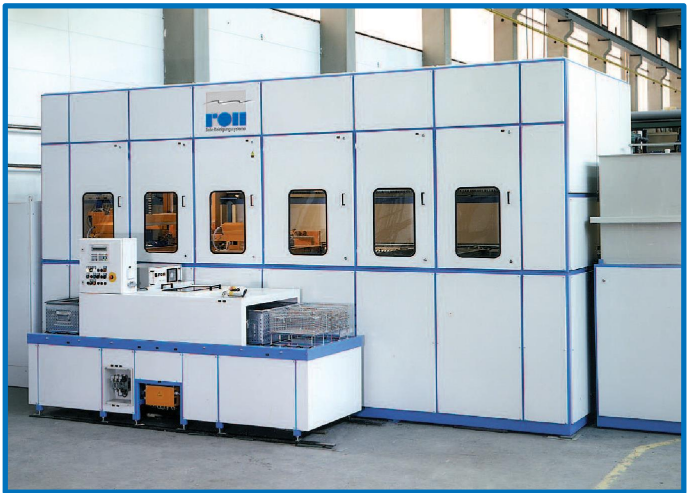
多腔浸没清洗设备，带多个清洗篮架