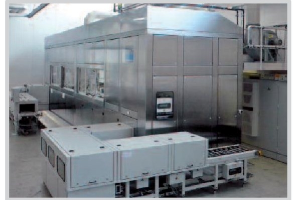
车间内全封闭的清洗设备

根据槽液管控需要，使用过滤器分离颗粒、用油分离器保护槽液、用蒸发器或完整的除盐水再循环设施维护漂洗槽。