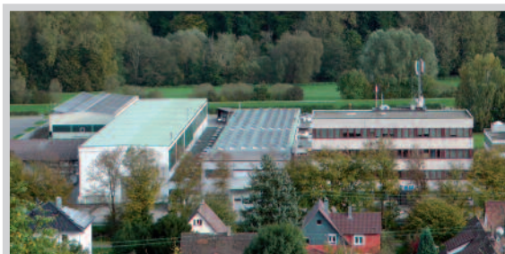
Site de production d'Enztl