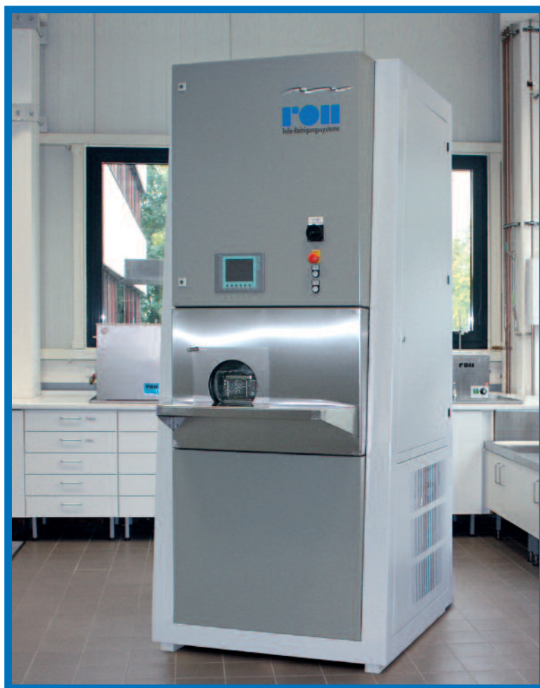
Installation de nettoyage „petite“ pour les applications standard