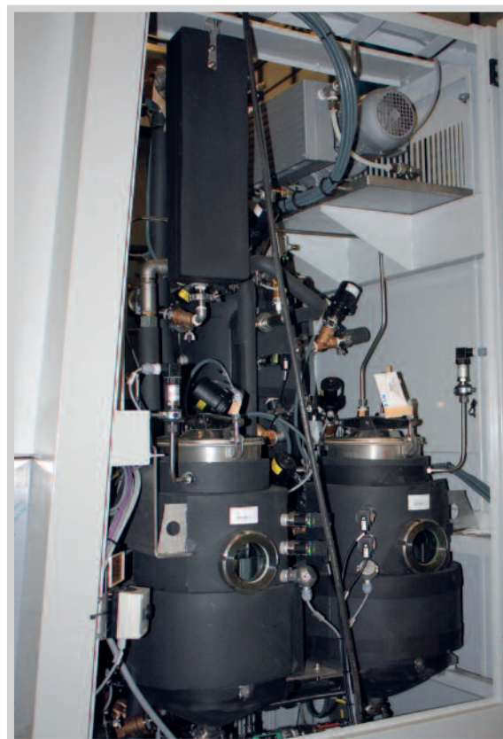
Intérieur de la „petite“

Installations de nettoyage et de dégraissage pour les fluides aqueux, les solvants chlorés et les hydrocarbures.